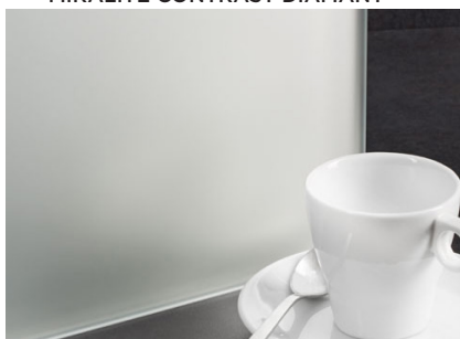
MIRALITE CONTRAST DIAMANT